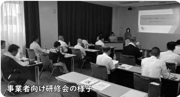
事業者向け研修会の様子